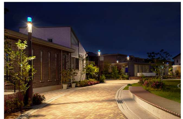
導入事例：埼玉県朝霞市「あさかりードタウン」

防犯は単なる「被害を防ぐ対策」ではなく、安心して暮らせる街を維持し、住宅や地域の価値を支えるインフラへと変化しています。