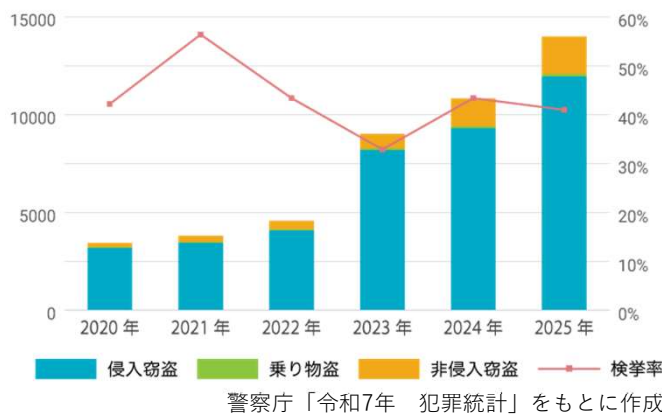
空き家の手口別認知件数と検挙率

しかし、 管理されない空間が地域の安全性に影響を与える可能性 は、近年改めて注目されています。